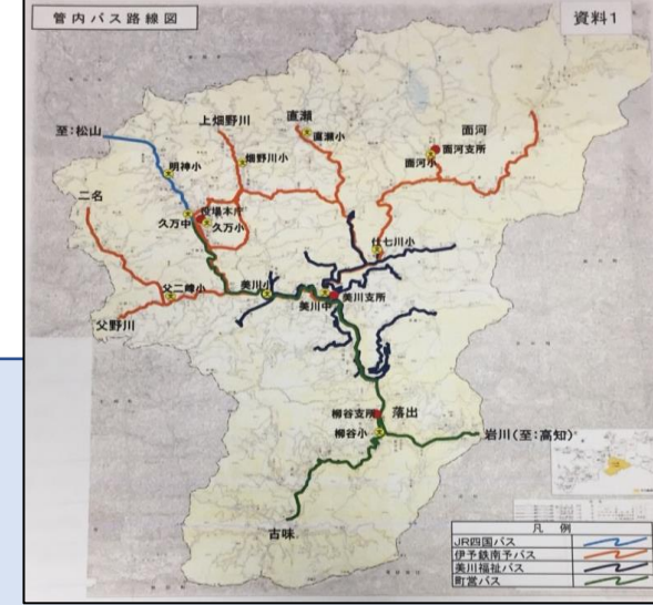
久万高原町 バス路線図